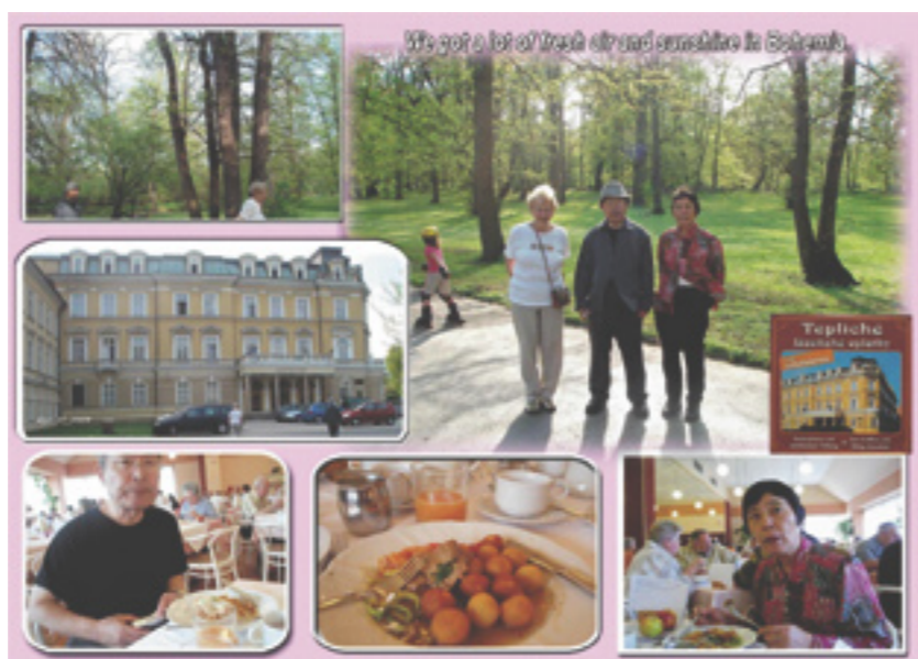
Pana Endo pobyt v lázních Teplice inspiroval ke kreativní tvorbě, kterou se nám pochlubil.