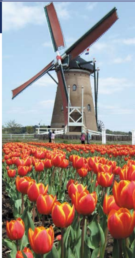
Připravujeme zájezd Květinové Holandsko od 6.5. do 9.5. 2010