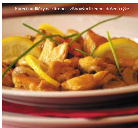
Kuřecí nudličky na citronu s višňovým likérem, dušená ryže